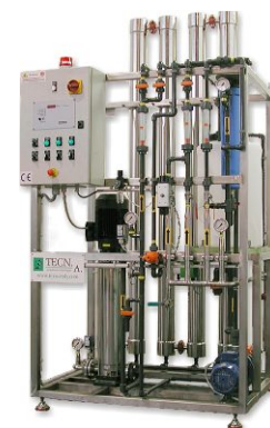
TECNA-NiCuREC 8 versione verticale per ingombri ridotti